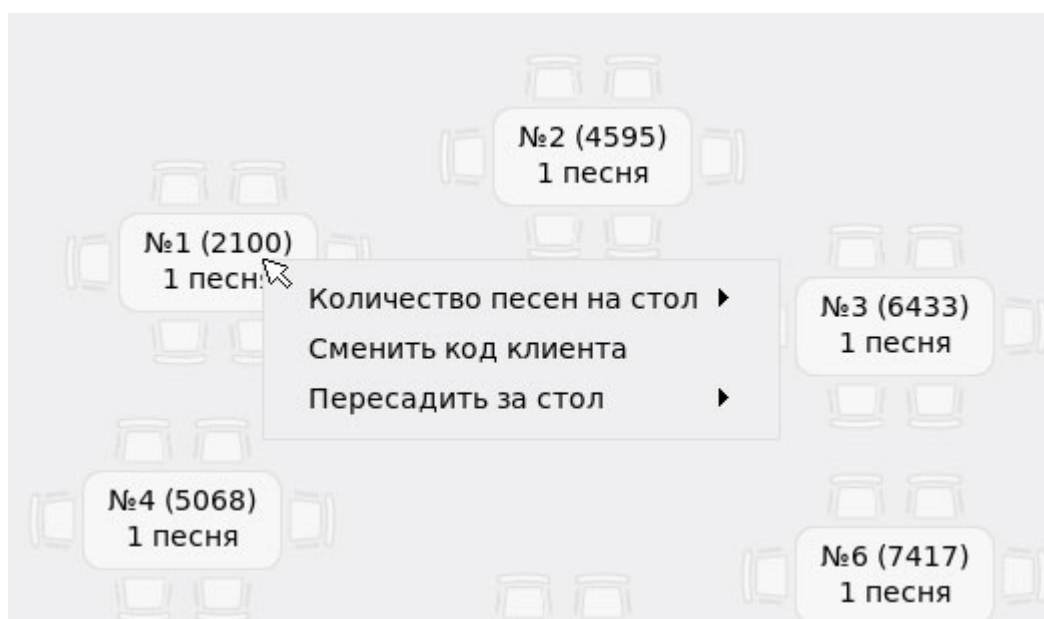
Рис. 3 Контекстное меню стола