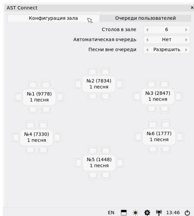
Рис. 1 Конфигурация зала

Виджет «AST Connect» предназначен для управления заказами и очередностью исполнений песен. Очередь формируется на основании заявок, поданных посетителями с помощью мобильного приложения. Работа «AST Connect» возможна только в режиме «Клуб».